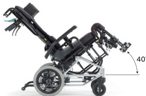
■ ティルト (レバー色/●オレンジ)

座面の角度を調整できるティルト機能と背もたれの角度を調整できるリクライニング機能を合わせ持つグランドフリッチャーなら、長時間の座位姿勢を安全・快適に保つことができます。