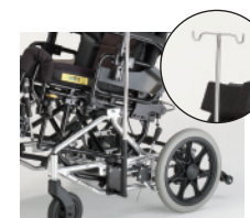
■ ガートル架ホルダー ¥3,500 ※点滴棒は別売りになります。