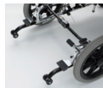
■ フットブレイキ ¥16,000