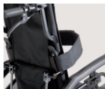
■ 調整式マジックシートベルト ¥4,500