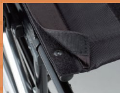
フラップ付きシート