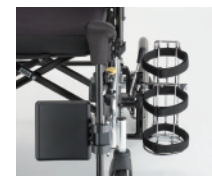
■ ボンベ架(側方取付け) ¥9,800 ※取付けには、ガートル架ホルダーが別途必要になります。