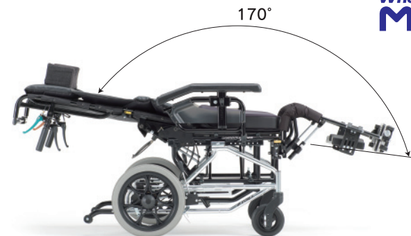
■ リクライニング (レバー色/●グリーン)