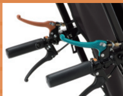
カラードレバー/ティルト:○オレンジ、 リクライニング:●グリーン

介助者に注意を促す「カラードレバー」、シートビスが直接お身体に触れないようにした「フラップ付きシート」、転落事故を防ぐ「転倒防止バー」など、安心・安全のための装備も充実させました。