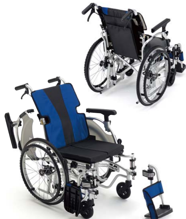
シートカラー:ブルー