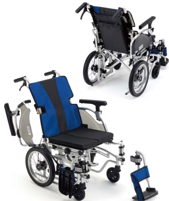
シートカラー:ブルー